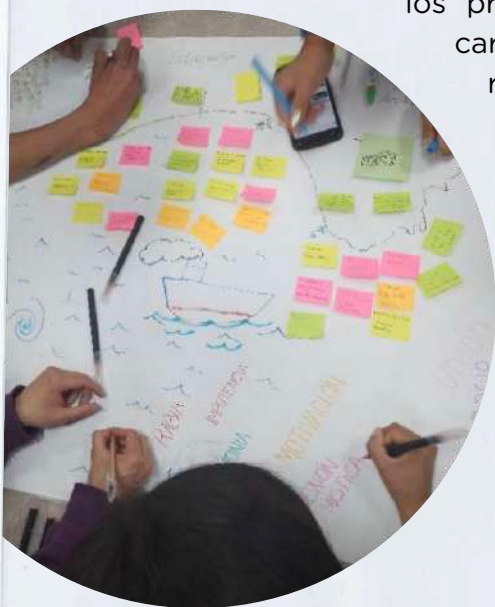
Cartografía social pedagógica.

Intercalados a las visitas a organizaciones sociales, estaban los espacios de aula, donde a través de metodologías participativas se relacionaba la experiencia con los contenidos y textos trabajados, buscando la síntesis e ideas fuerza para favorecer los procesos de aprendizaje. A través de cartografías sociales y mapeos colectivos reconocimos los principales sentidos de las formas alternativas de apropiación del espacio, buscando la reconstrucción de aquellas dimensiones que interfieren en el habitar. Al integrar la vivencia, el diálogo social y la lectura crítica, se facilita el aprendizaje.