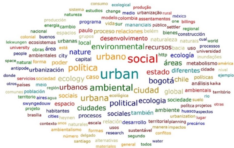
Figura 2. Ecología política asociada a lo urbano

Las figuras nos ilustran un eje matizado de divergencia en términos de ocurrencia en el uso de ciertas categorías. En