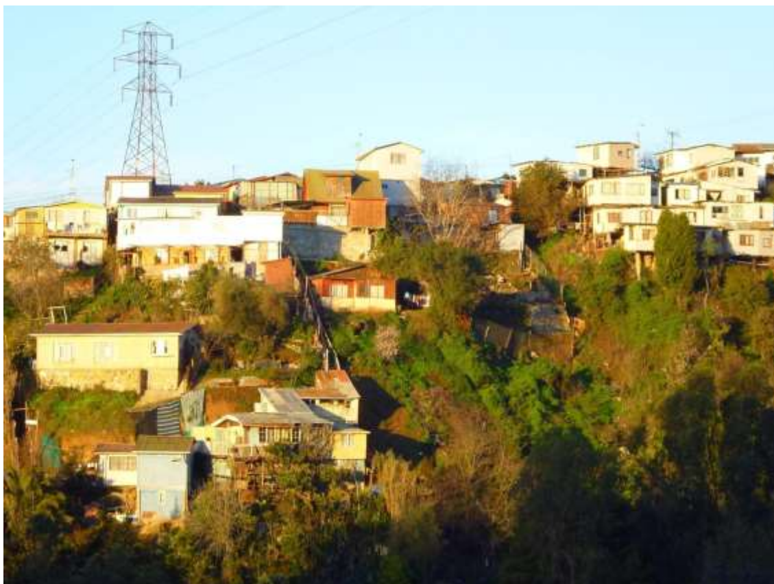
Imagen 1. Extensión de las viviendas hacia las quebradas.