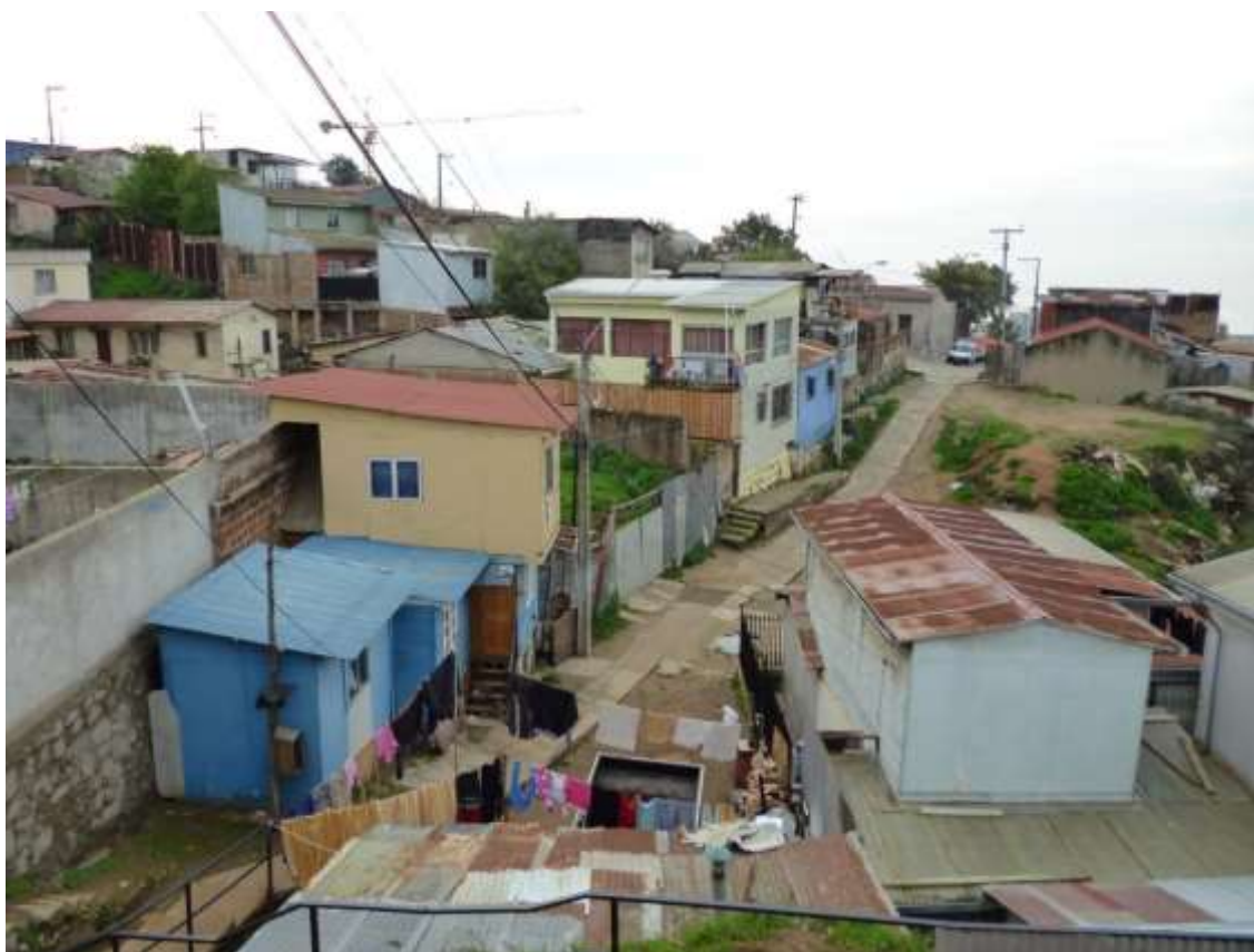
Imagen 2. Viviendas autoconstruidas en Rodelillo.