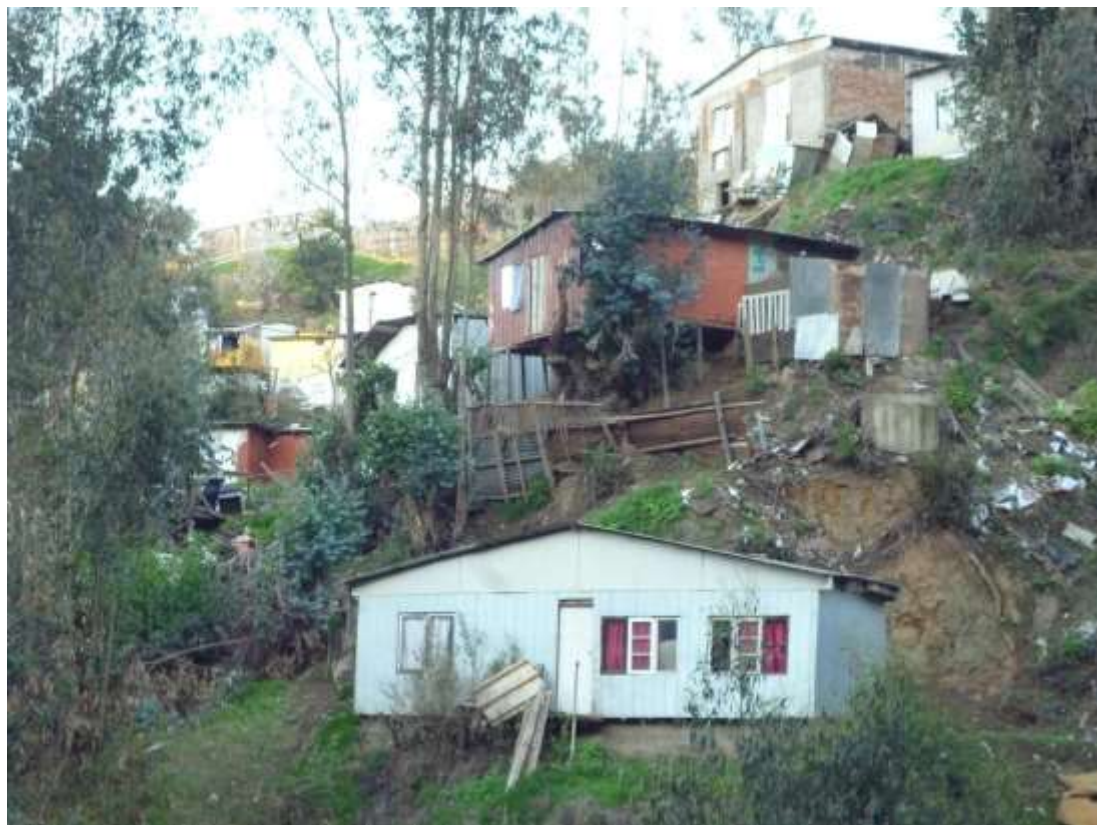
Imagen 3. Casas estilo palafito en la quebrada de los cerros.